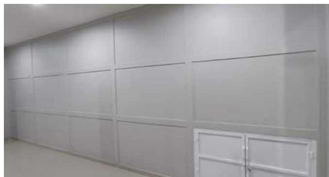
Gbr.4 Lantai 1 Mausoleum St. Al Gonzaga