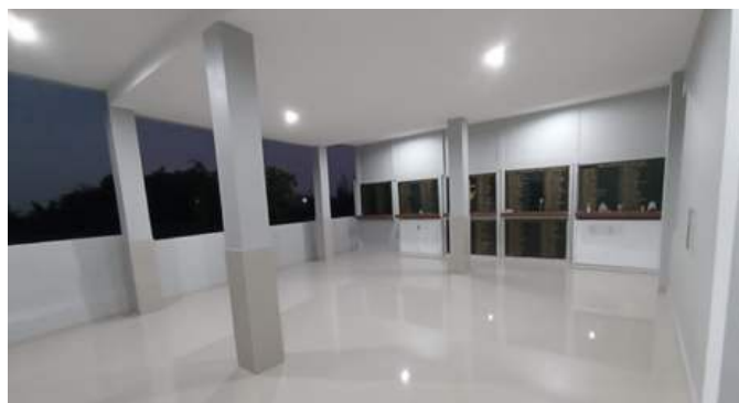
Gbr.3 Lantai dasar Mausoleum St Al Gonzaga