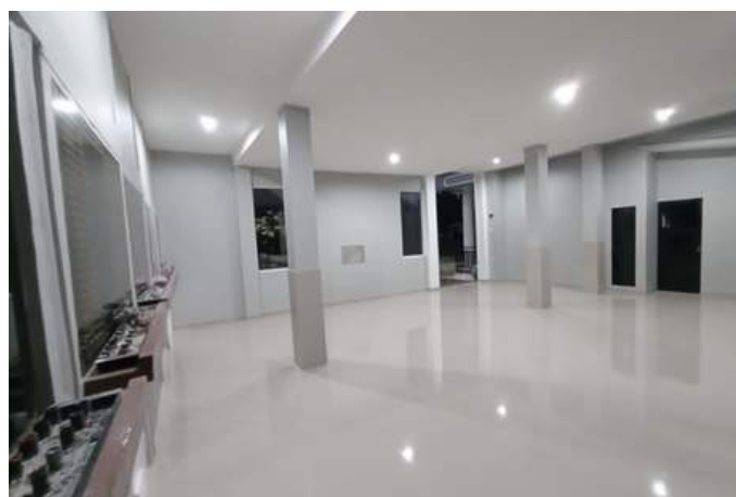
Gbr.3 Lantai dasar Mausoleum St Al Gonzaga