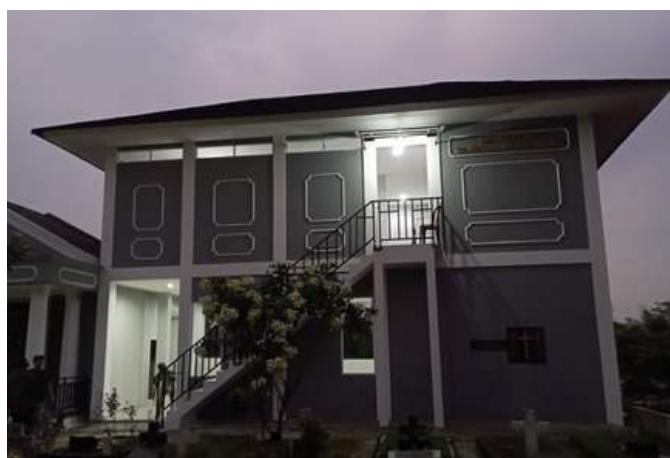
Gbr.2 Gedung tampak dari Depan