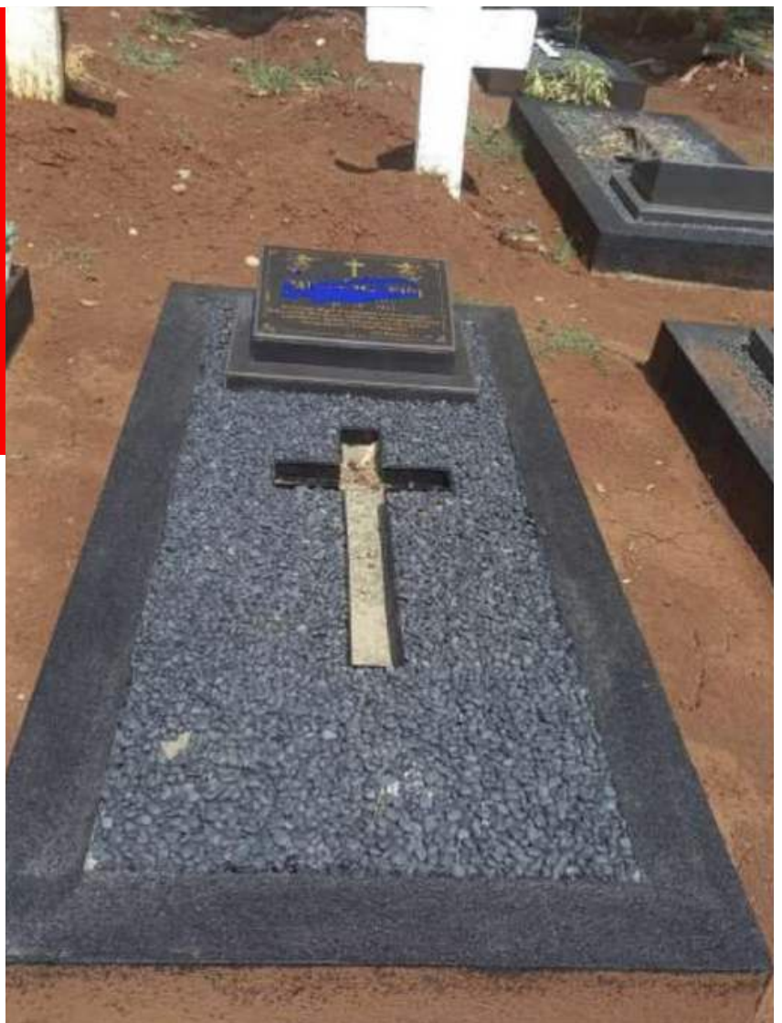
Contoh : "Nisan Makam" Standard RKUK TPBU-St Yusuf, Kalimulya-1